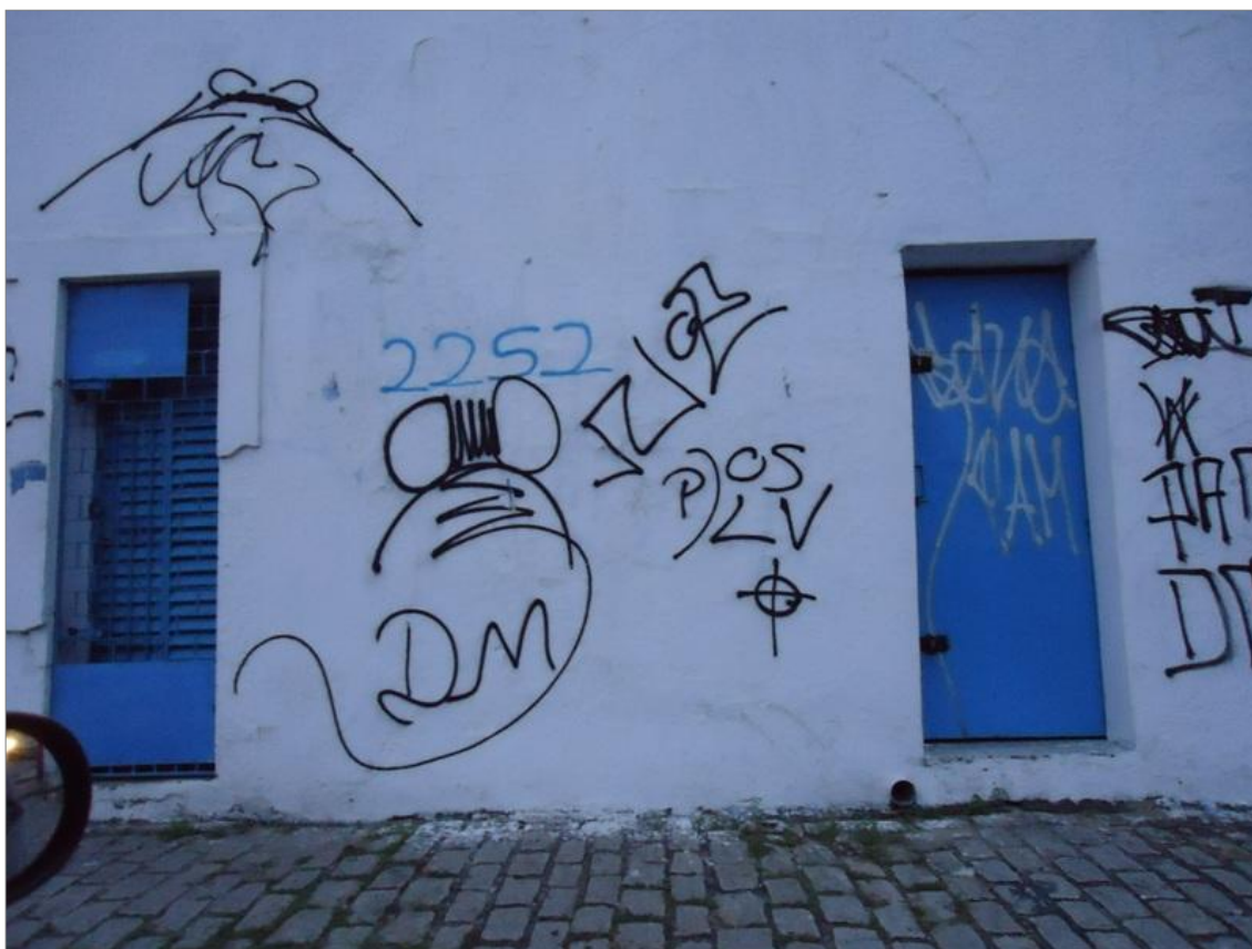
IMAGEM 23: Para os L.V. “de rocha”.

As palavras de Hugo traduzem a genealogia do símbolo “de rocha” frequentemente encontrado nos muros. Segundo ele, “de rocha” simbolizava o comprimido que recebia esse nome pelo seu fabricante. Esse “de rocha” é um símbolo dos anos 2000, que adquiriu hoje significados mais abrando, na linguagem oral ele é utilizado por vários jovens, não necessariamente pixadores. “De rocha” ou “rochedo” significa uma afirmação “de verdade”, “pode crer”; no mesmo sentido semântico “rochedo” significa “firmeza”, “massa”, “ta de boa”.