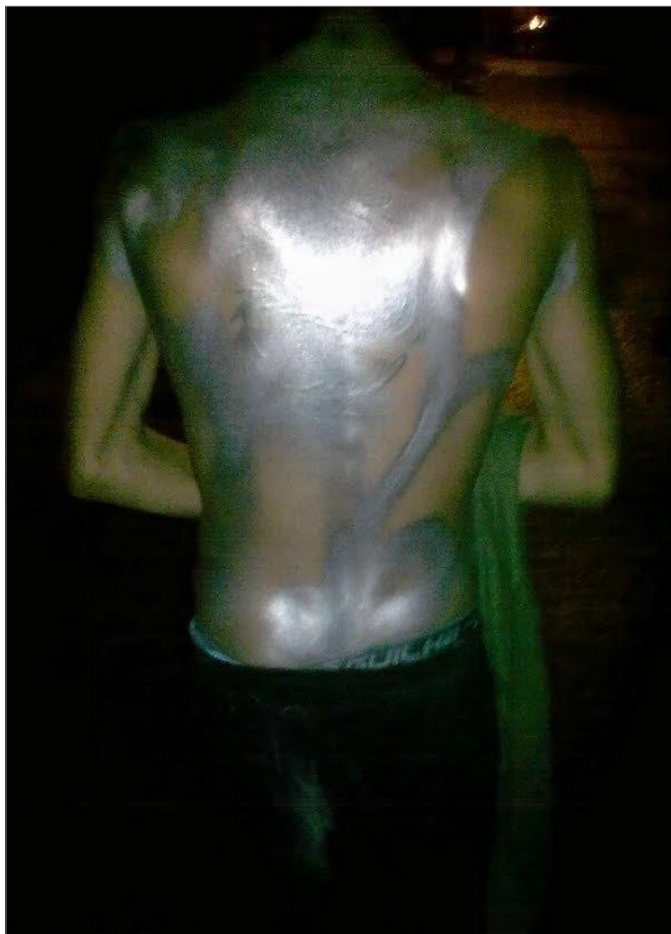
IMAGEM 19: “Rodar faz parte”, pichador que foi pego e teve seu corpo riscado com o spray.