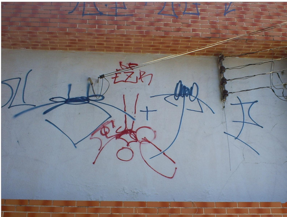
IMAGEM 17: Fachada do Camelódromo na av. Guilherme Rocha, Fort-CE. (2011)