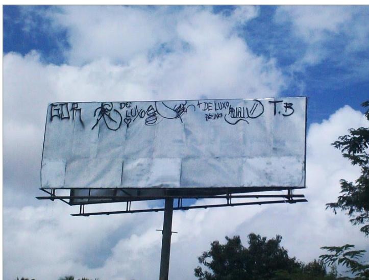
IMAGEM 27 : Pixações em outdoor. Fortaleza – CE.

Alguns pixadores se utilizam de imagens que fortemente denotam violência como portando armas, muitas notas de dinheiro e/ou drogas. Outros, que, provavelmente, não são usuários de drogas ou que não fazem parte do tráfico, apenas exibem imagens de pixação. Apresentando, principalmente, xarpis em alturas. A frase: “A lei do mais alto” na referida imagem 26, representa a competição “top” da pixação: os picos .