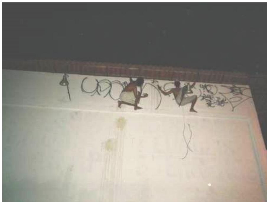
IMAGEM 28: “Homem Aranha”. Anos 90. Fortaleza – CE.

Um outdoor vazio é “prato cheio” para os pixadores que passam por ali. A placa no alto vazia de imagens está servindo para dar destaque a “arte da pixação”. Os pixadores se apoderam do espaço superior do outdoor, preenchendo seu espaço de uma ponta a outra. Essa estratégia é feita para evitar que outro pixador interfira no espaço que é daquele grupo, se vacilar de deixar um espaço vazio, outros irão se intrometer no paredão .