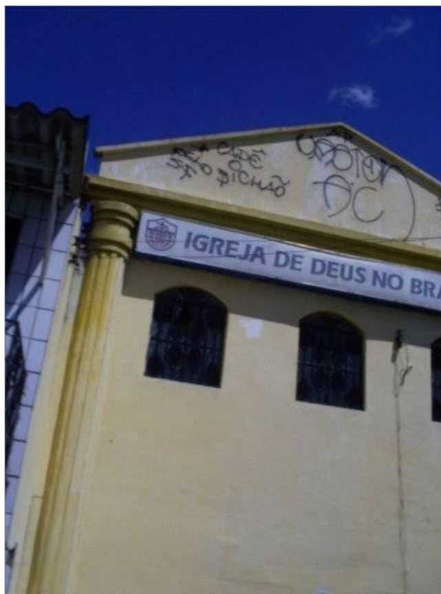
IMAGEM 24: “Cadê o Bichão?”. Anos 2000. Fortaleza – CE.

As frases de rivalidade expressa nos muros inflamam o conflito entre os pixadores ou entre siglas. Se não houver humildade (termo frequentemente utilizado por eles) a rixa pode tornar-se mais séria e perigosa. Arquetipicamente, acontece uma caçada, onde um dos pixadores se armam e vai atrás do pixador inimigo para resolver o conflito da forma mais cruel, ou seja, executando-o. (Como verificamos nos relatos presentes no sub-capítulo “O conflito entre os pixadores”).