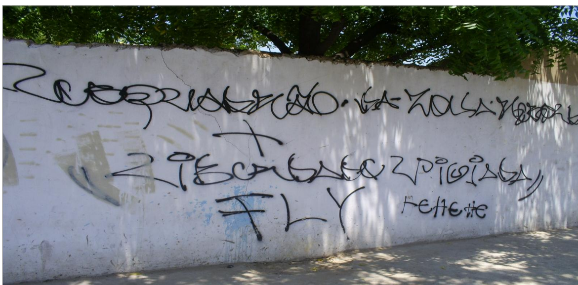
IMAGEM 15: Esquadrão da Zona Rebelde + Liberdade Viglada. (2011) Av. Tereza Cristina. Fortaleza – CE.

Essas sociabilidades estimulam os pixadores a tacar ou atacar (com permissão do trocadilho) a cidade em maior quantidade possível. Quanto mais se risca a cidade, mais se gera comunicação nas galeras de pixação, tornando maior a possibilidade de convites para mudar de sigla ou assinar em conjunto. A simbologia do + na pixação tem idéia de agregação tal qual a matemática, ela é bastante utilizada quando os pixadores saem juntos para riscar. Cada qual põe seu xarpi no muro lado a lado unidos pela simbologia do + entre estas inscrições.