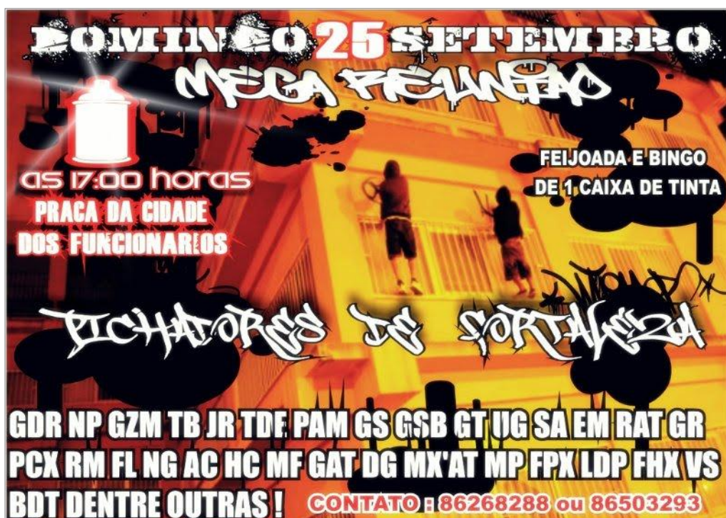
IMAGEM 16: Convite virtual para reunião de pixadores.

congregação. A sociedade assim os vê como um grupo qualquer de jovens se reunindo, conversando, bebendo.