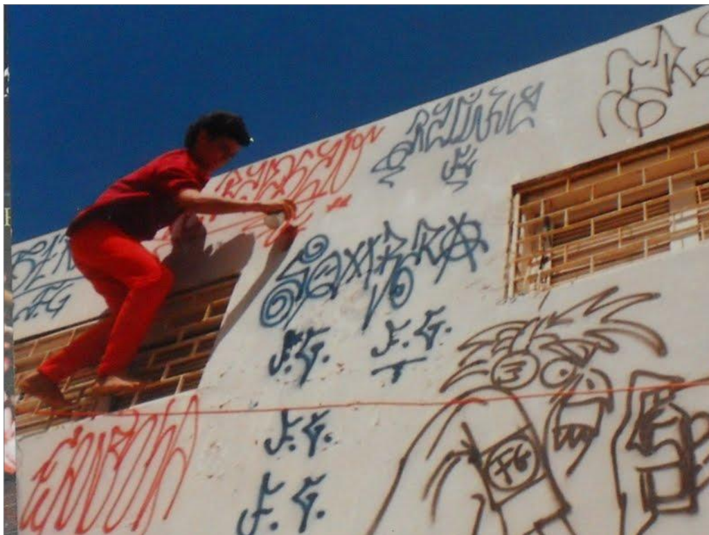
IMAGEM 35: “Raposão F.G.” (1990). Xarpis de Raposão, Ratinha, Sombra e Gabola.