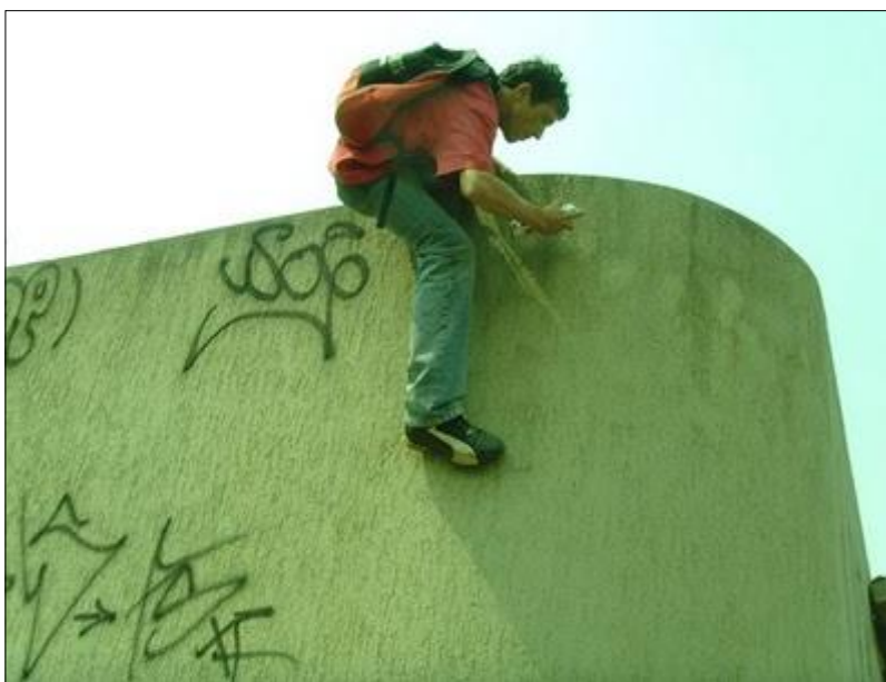
IMAGEM 04: Pixação em altura no Rio de Janeiro.