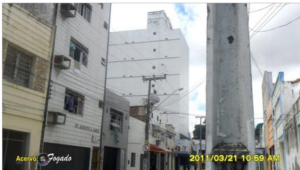
IMAGEM 29: “Vem na trilha”. (s/ data) Fortaleza – CE.