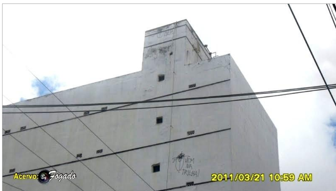
IMAGEM 30: “Vem na trilha”. (Detalhe)

A imagem 30 é comentada pelo pixador Snow T.B. em uma conversa de bate-papo: