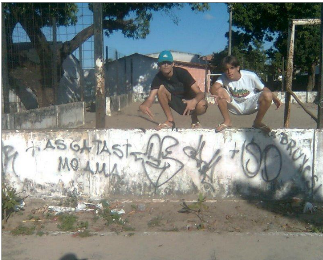
IMAGEM 34: “As gatas me ama”. Fortaleza – CE.