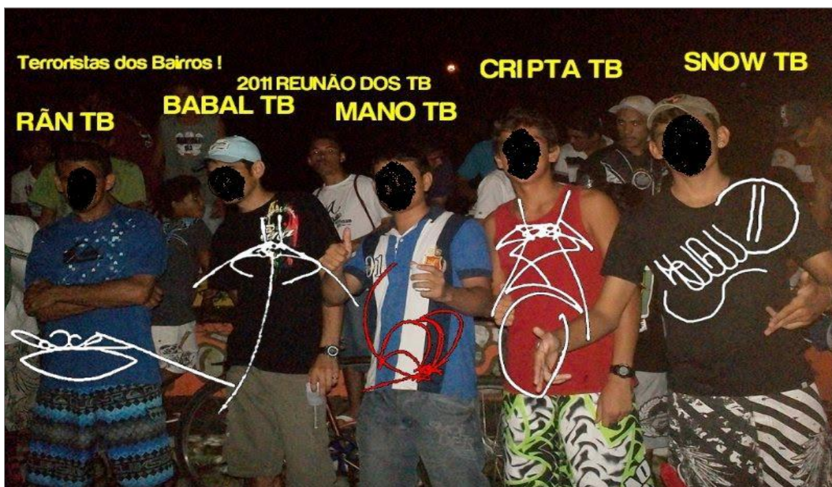
IMAGEM 10: Os xarpis. Os rostos receberam uma tarja para preservar suas respectivas identidades.