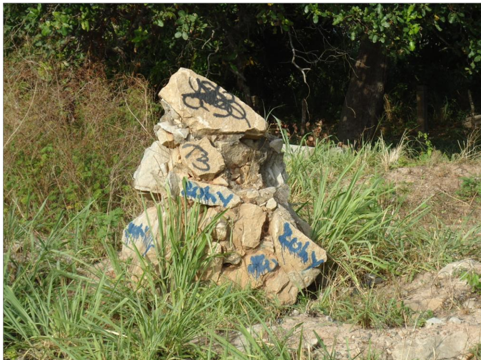
IMAGEM 31: “Pixação na pedra”. Margem da BR 116, Itaitinga-CE. (2011)