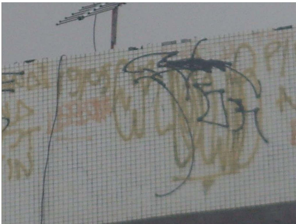
IMAGEM 25: “19/03/ ? O REI!!!! TANGO ER”. Fortaleza – CE.

Alguns pixos nos muros estão antigos, a tinta spray que antes era viva se esmaece numa coloração amarelo-esverdeada e os amigos contemporâneos tentam preservar através de fotos as marcas que ainda existem dos primeiros a construir a história da pixação em Fortaleza. A vontade é que o xarpi seja inesquecível assim como foram os seus escritores, permeando a memória dos “reis do xarpi” através das imagens nas redes sociais.