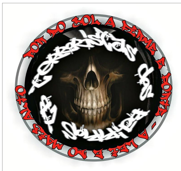
IMAGEM 26: “Por do Sol: a firma é forte. A lei do mais alto”

E nessa busca de fazer-se ver na metrópole e na internet os pixadores exibem suas melhores imagens das ações nas ruas, canções, símbolos e imagens que promovem significações de poder, força, fúria e etc.