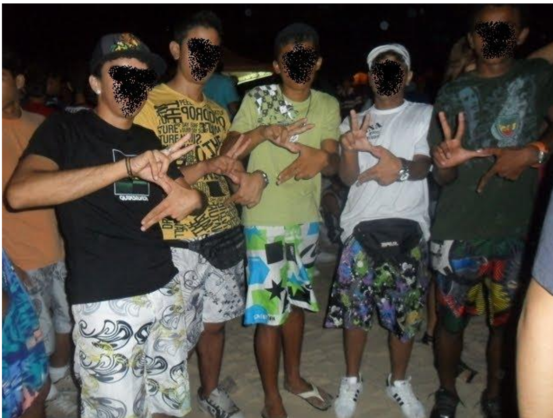
IMAGEM 05: Pixadores simbolizam as iniciais da sigla V.S. com as mãos. (Vagabundo Safado). Fortaleza – CE.