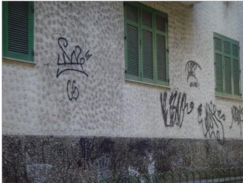
IMAGEM 02: Estilo gráfico de pixação no Rio de Janeiro.

da pixação carioca e a fortalezense, o xarpi é curvo ou embolado, com letras sobrepostas, a dinâmica de execução é semelhante também, é um traço contínuo do começo da primeira letra do xarpi à letra final. Em contraposição, a pixação paulista é detentora de uma caligrafia única, seu xarpi é executado letra por letra, há um estilo de linhas e ângulos retos.