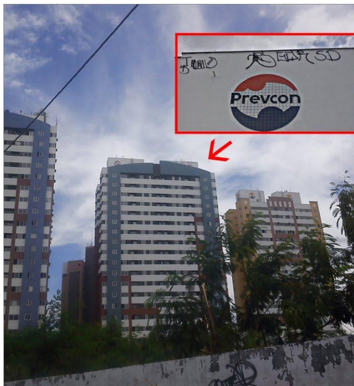
IMAGEM 33: “TB PREVCON 20 ANDARES. VAI VENDO!”. Fortaleza – CE.

Essa dedicação ao xarpi é justificada pelo o que a cultura da pixação pode promover ao jovem pixador: reconhecimento, fama, amizades, paqueras. No meio desse meio majoritariamente masculino existem figuras femininas que motivam a atividade da pixação, são as admiradores dos mais afamados pixadores. Elas desejam ficar ou namorar um pixador, e ganham dedicatórias nos muros. Os garotos se utilizam da consideração para se sobressair em vantagem na conquista feminina, eles explicam que “as gata piram” ou que “as gatas me ama” (imagem 34).