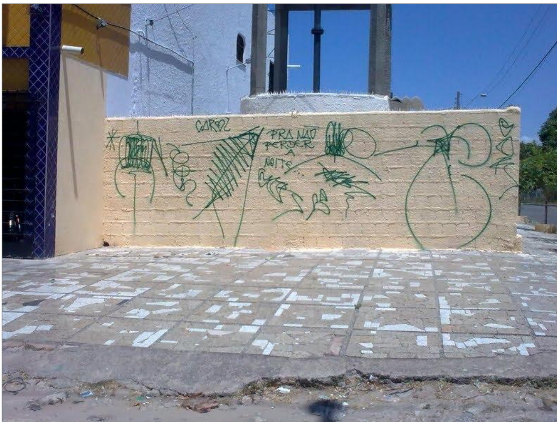
IMAGEM 32: “Pra não perder a noite”. Fortaleza – CE.

Olhando o álbum de fotos das incursões de um pixador verifico sua preocupação em fotografar duas vezes sua pixação e fazer uma sobreposição entre as duas imagens. Na imagem 31, vemos como uma foto que apresenta uma visão geral da paisagem, com um prédio ao centro da imagem e o céu ao fundo. Nesta mesma imagem, sobreposta à foto de fundo, revela-se o detalhe oculto de uma pixação, suscita, então, o entendimento de que sua pixação está localizada no topo daquele prédio. As duas fotos se complementam, e o autor a comenta dizendo “T.B. PREVCON 20 ANDARES. VAI VENDO!”.