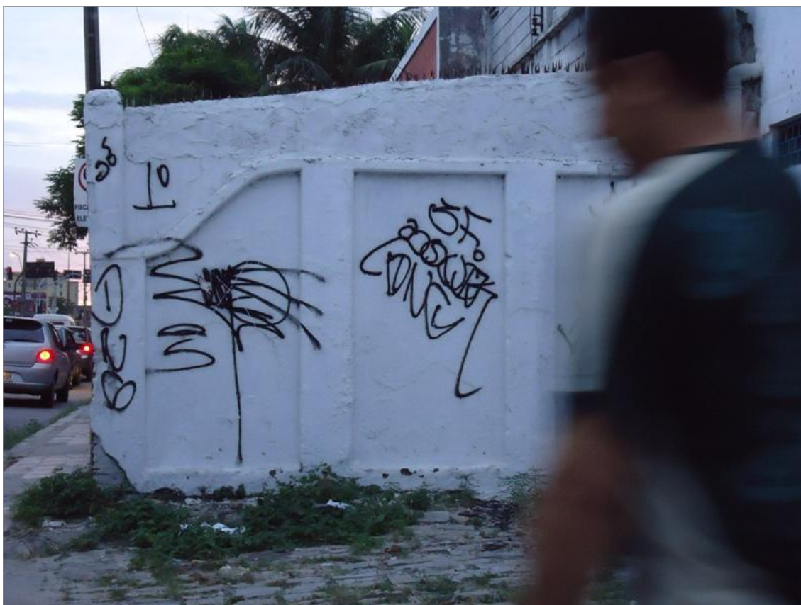
IMAGEM 13: Xarpi com a simbologia do nº 1. Av. Francisco Sá.

A simbologia do pódio representa o lugar de destaque para os melhores. Essa plataforma geralmente de três níveis territorializa o local dos vencedores. Pódio é uma palavra que em sua semântica representa poder. Esse poder de conquista simbolizado em destaque ao número 1, ocorre também na cultura da pixação quando o pixador considerado representa seu desempenho nas ruas com a simbologia do número 1.