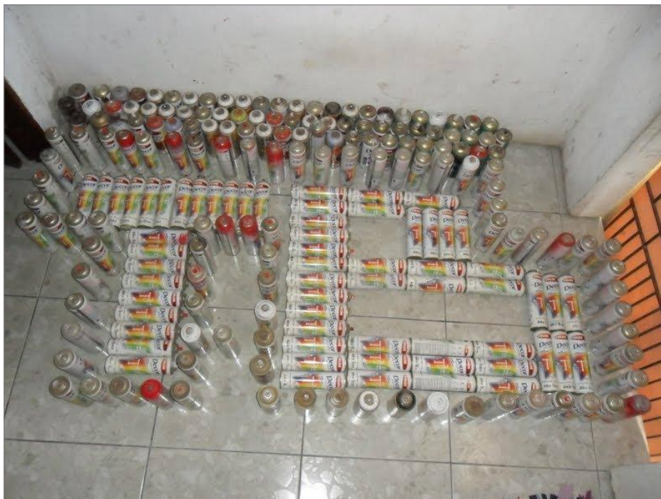
IMAGEM 22: Simbologia de poder.