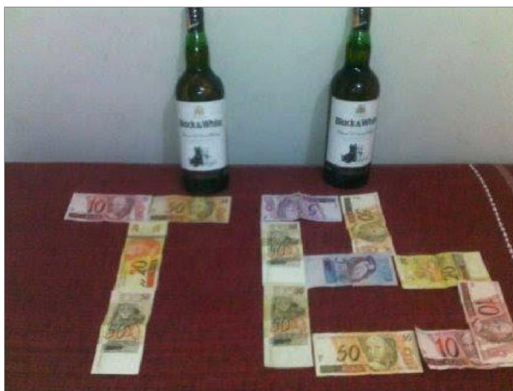
IMAGEM 20 e 21: Símbolos de violência e poder.