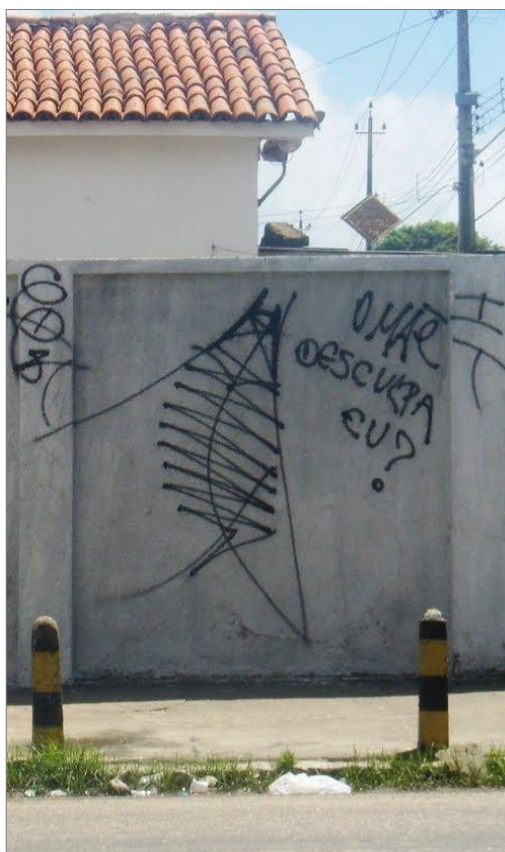
IMAGEM 18: “O mãe desculpa eu?”. Xarpi de Bafu G.D.R. (Garotos de rua). Fortaleza – CE.

“Pixador existe pela própria sociedade” . (Pivetta 35 ) “Você vai na quebrada do cara não tem biblioteca, o ensino público é uma bosta, entendeu? Tem muito cara que começa a pixar na escola, porque a escola é tão fraca que o cara não consegue nem se apegar” . (Cripta Djan 36 ) Alguns discursos de pixadores são dotados da reflexão sobre suas condições sociais em uma metrópole. Suas justificativas são baseadas na realidade da vida, suas dificuldades cotidianas, os problemas sociais existentes há várias gerações familiares. A família do pixador como a maioria das famílias pobres constituísse de uma ausência do pai, a mãe é que leva adiante a criação dos filhos e é geralmente fonte única de renda. A mãe é uma personalidade visível em letras de rap ou em pixos.