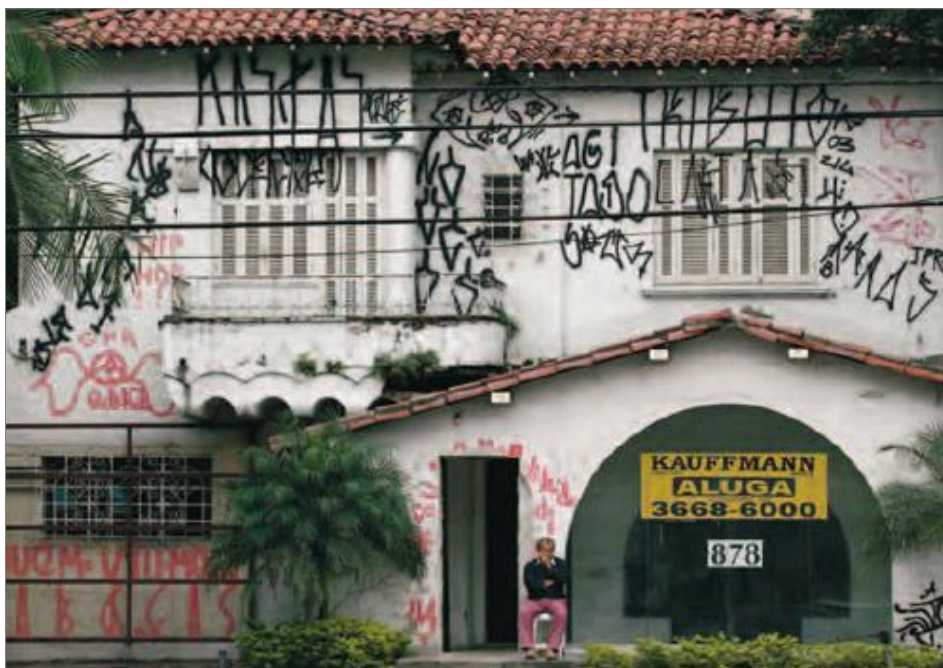
IMAGEM 03: Estilo gráfico de pixação de São Paulo.